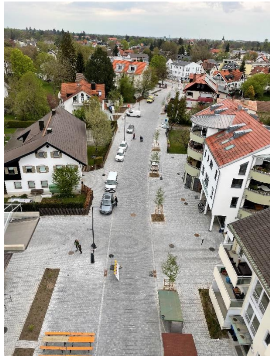
Blick auf die neugestaltete Ortsmitte.